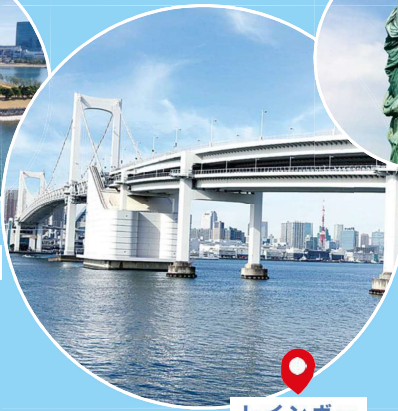
レインボー ブリッジ